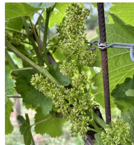
Aktuální rozdíly v kvetení odrůd – Ryzlink vlašský nahoře, Dornfelder dole