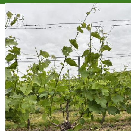
Současný stav vegetace – Velké Bílovice